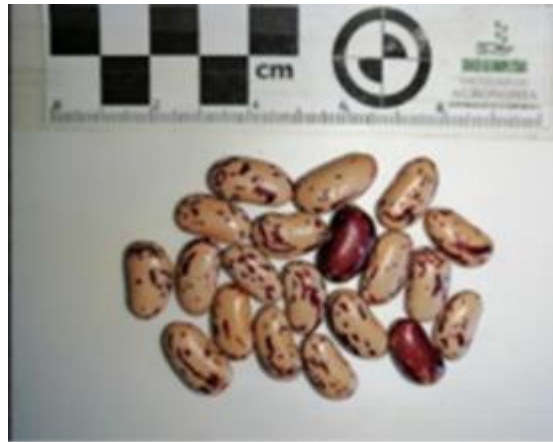
P. vulgaris 1977