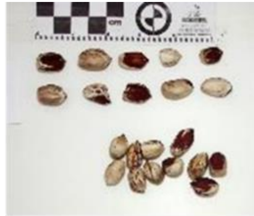
A. hypogaea 1985